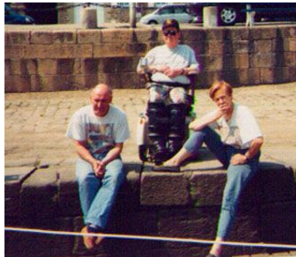
J-4 le 17 Mai 1998 Paimpol quai pierre LOTI On fête la Saint-Pascal et on filme pour la vidéo