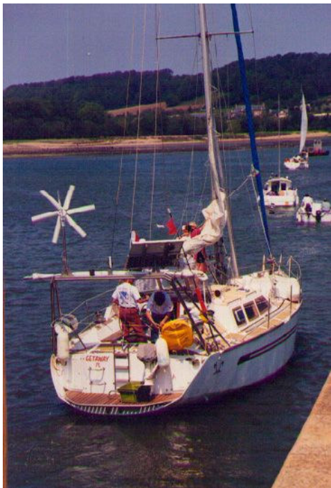
le 21 mai 1998 : La sortie de l'écluse de paimpol

Je dédie ce No 1 à mon cher papa (notre Papy à tous) qui n'a pas réussi à me faire plonger, parce que j'étais une tête de mule , mais qui m'a fait aimer la mer